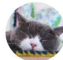
コマさんちゃん(1歳)

排尿回数と尿量が把握できるので、回数や尿量が少ない日はウェットフードやミルクを愛猫の好むものにして水分摂取量を増やすなどフル活用しています。留守中に通知が来るのも、無事が分かってとても嬉しくなります。