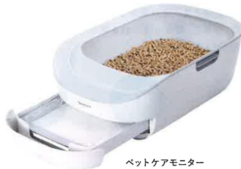
ペットケアモニター HN-PC001-W

・スコップ・チップ・試供品シート付 ・サイズ(約): 本体=幅380mm×奥行576mm× 高さ210mm(取っ手部含む)