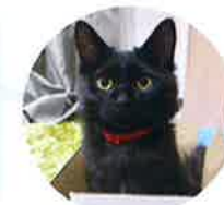
ラグナロックちゃん(5ヶ月)

初めての猫の飼育なので、猫の体重や尿量の変化がグラフとして分かるのは、猫の成長を感じられて良いと思いました。設置場所の気温が低い場合に通知が来るのも、ありがたいと感じました。