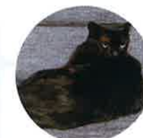
クッキーちゃん(4歳)

以前飼っていた猫ちゃんが病気になったとき気づいてあげられなかったのが、今の猫ちゃんの健康を管理したいと思い申し込みました。トイレ使用時のデータがたまっていき、変化が分かるので頼れるトイレです。